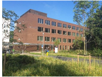
Maatweg 3, 38138TZ, Amersfoort