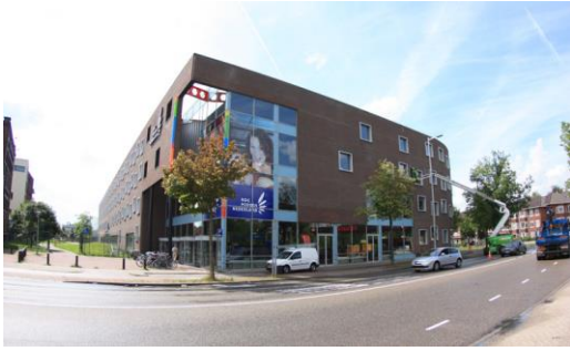
Vondellaan 174, 3521 GH, Utrecht